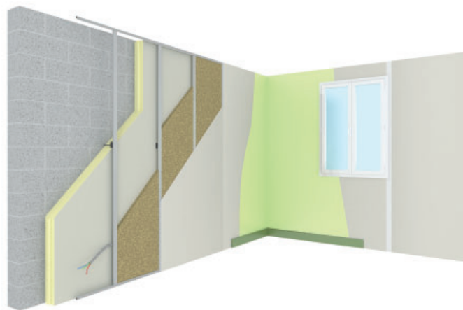
Montage avec sous couche acoustique

Sur un support vertical maçonné conforme aux DTU 20.1 et 23.1, le panneau EUROTHANE® Mur est mis en œuvre par emboîtement - sans collage ou par collage avec du mortier adhésif - sur support sain et sec.